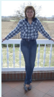
nachher mit 75 kg

Das Glück Deines Lebens hängt von der Beschaffenheit Deiner Gedanken ab.