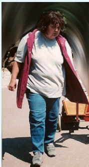
vorher mit 147 kg

Meine eigene, deutliche Abnahme von insgesamt 75kg ist das beste Beispiel für eine erfolgreiche Gewichtsreduzierung. Diese Erfahrungen und mein Wissen über Ernährung möchte ich gerne an Sie weiter geben, damit auch Sie Ihr Gewicht langfristig reduzieren und sich wohl fühlen.